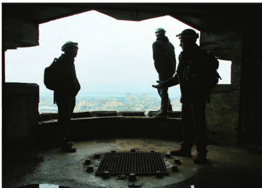
La visite de la Batterie permet d'avoir un point de vue exceptionnel sur Cherbourg-Octeville et sa rade.