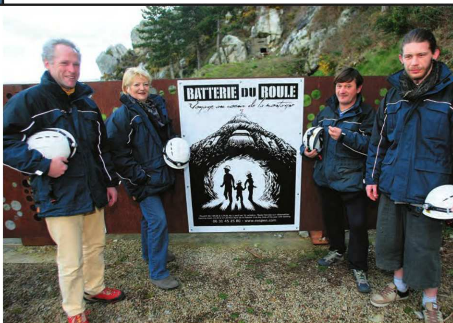
L'équipe d'Exspen accueille les groupes jusqu'à 18 personnes toute l'année sur réservation.

L'association Exspen propose depuis novembre dernier des randonnées pédestres pour découvrir l'histoire de La Batterie du Roule. Exploration de ce site souterrain, creusé pendant la Seconde Guerre mondiale et classé aux Monuments Historiques.